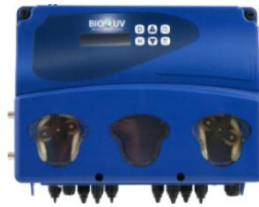
Régulateur oxy + ph moins